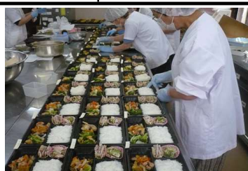
お弁当作りの様子