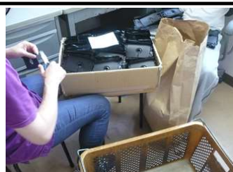
ゴムの内職作業の様子