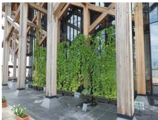
愛媛県武道館グリーンカーテン施工（15m×5m）