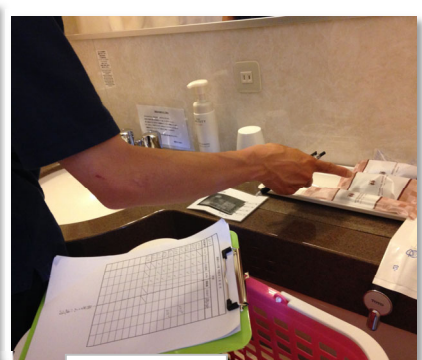
アメニティのセット作業