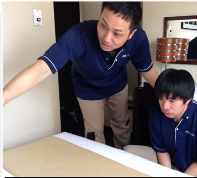
ベッドメイキングの指導中の様子 真心をこめて、優しく明るく教えます