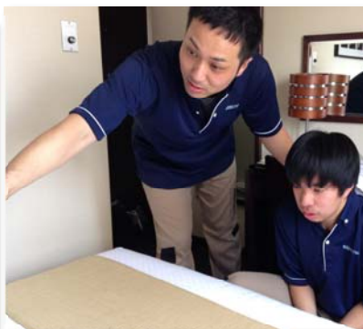
ベッドメイクの指導中の様子 真心をこめて、優しく明るく教えます